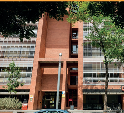
CENTRE CÍVIC LA GAVARRA