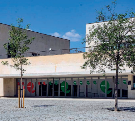
CENTRE CÍVIC PARC ESPORTIU LLOBREGAT (PELL)