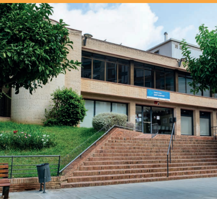
CENTRE CÍVIC SANT ILDEFONS